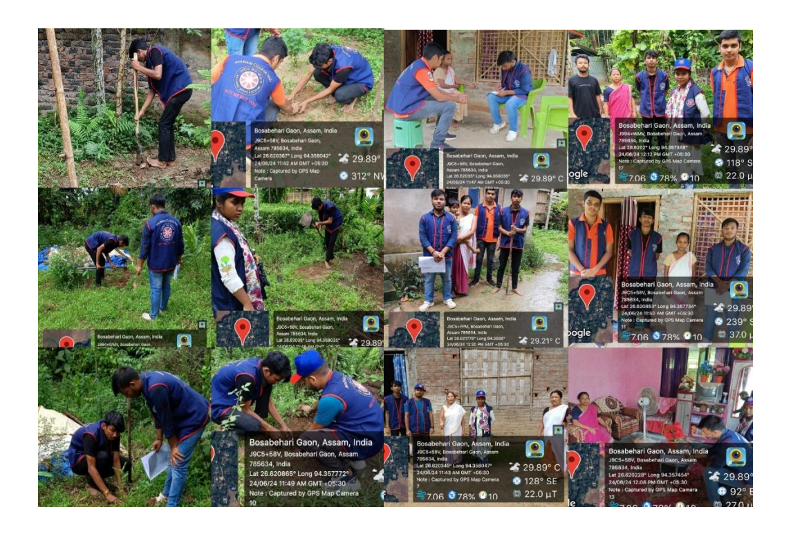
Day 6 (25th June,2024)

The sixth day of the 7-day 'NSS special campaign' started with a gathering for sports activities at the school field campus. Sports activities both for girls and boys were held separately at 9:00 a.m. Participants first engaged in a Running session. Following the Running Session, a sack race competition was held among the students of the school which bought a lot of joy and laughter.